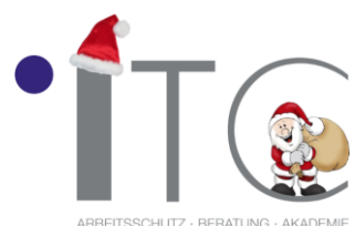
ARBEITSSCHUTZ · BERATUNG · AKADEMIE